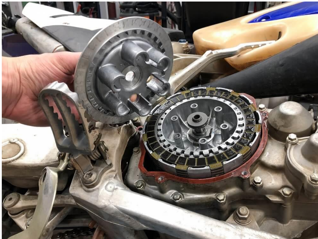
تعمیر گیربکس مزدا

خرابی کامپیوتر خودرو: در برخی موارد، خرابی کامپیوتر خودرو می‌تواند باعث خرابی گیربکس شود. در هر صورت، برای جلوگیری از خرابی گیربکس مزدا، توصیه می‌شود که به دوره‌های تعویض روغن گیربکس توجه کنید و از استفاده صحیح از گیربکس اطمینان حاصل کنید.